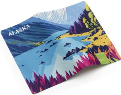
Ansicht des fertigen Displaytuchs